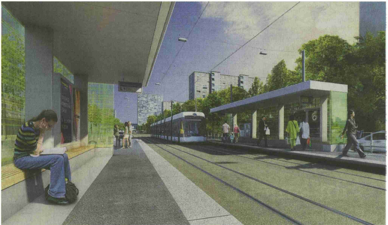
Visualisierung der Haltestelle Furtalstrasse in Spreitenbach, mit den Hochhäusern Langäcker und Shoppi.

Spreitenbach Kanton, Gemeinden und Planer informierten über das neue Verkehrsmittel im Limmattal